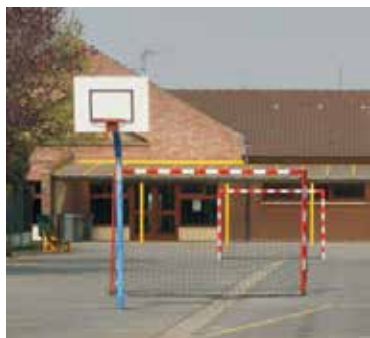
Terrains de basket et de Hand-ball