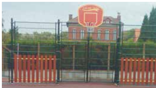
Le terrain multisports