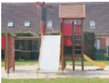
La citadelle d'Elfes