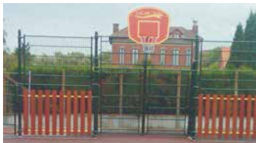
Le terrain multisports