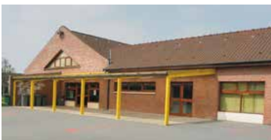
Salle d'évolution sportive