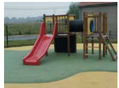
Terrain de jeux du Clos des Hellébore