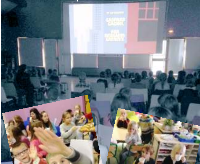
Et goûter gourmand